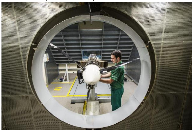
Obr.: Testování turbovrtulového motoru TJ 1P100 ve zkušebně letecké divize PBS

„Dnes představuje vývoj, testování a výroba zařízení pro letecký průmysl nejvýznamnější část naší produkce. Začali jsme s pomocnými energetickými jednotkami a klimatizacemi pro letouny a vrtulníky, později jsme přidali proudové, turbovrtulové a turbohřídelové motory rovněž vlastní konstrukce. Kromě vlastního vývoje a zkušebny disponujeme i širokým výrobním zázemím strojírny a slévárny, které nám poskytuje značnou soběstačnost,“ vysvětluje M. Kafka. V letošním roce se firmě dokonce podařilo představit s odstupem pouhých několika měsíců hned dva nové proudové motory.